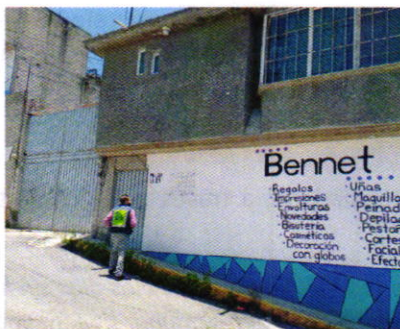
Figura 1. Vista del sitio referido en el escrito de denuncia.

En este sentido, de las constancias que obran en el presente expediente, se desprende que personal de esta Procuraduría llevó a cabo una visita de reconocimiento de hechos, de acuerdo a lo establecido en el artículo 15 BIS 4 fracción IV de la Ley Orgánica de esta Entidad, diligencia durante tocamos en repetidas ocasiones la puerta del inmueble de referencia; sin embargo, dichos requerimientos no fueron atendidos. Es de señalar que desde el espacio público no se constató la existencia de algún ejemplar canino, ladridos provenientes del interior del inmueble en comento u olores característicos de su presencia.