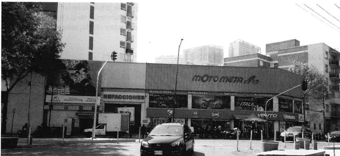
Fotografía 1. Fachada del establecimiento objeto de denuncia.

En este sentido, de las constancias que obran en el presente expediente, se desprende que personal de esta Subprocuraduría se constituyó dos veces en el punto de denuncia de acuerdo con las citas concertadas con la persona denunciante, lo anterior a efecto a llevó a cabo un estudio de emisiones sonoras desde el lugar en el que se percibe la mayor molestia, sin embargo, durante ambas diligencias no se constataron emisiones sonoras susceptibles de medición acústica provenientes del establecimiento en comento.