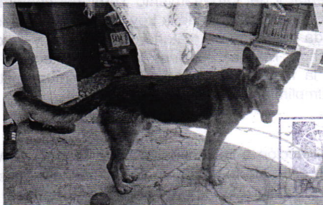
Fotografía 1. Vista del ejemplar canino que responde al nombre de "Bolt"

En virtud de lo anterior y toda vez que no se constataron los hechos denunciados, esta Entidad considera procedente dar por concluida la investigación, con fundamento en lo dispuesto en el artículo 27 fracción III de la Ley Orgánica de la Procuraduría Ambiental y del Ordenamiento Territorial de la Ciudad de México.