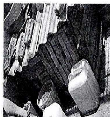
Imágenes 1 a 2. Se observa a los animales motivo de la denuncia y las condiciones de alojamiento.

En seguimiento de lo anterior, personal de esta Subprocuraduría realizó dos visitas de reconocimiento de hechos adicionales, durante las cuales se constató que los sitios de alojamiento de los felinos habían sido adecuados a fin de mantener libres a los animales, en un espacio suficiente para expresar su comportamiento natural, contando con refugio, además de que presentaban aumento en su masa muscular; no obstante lo anterior, y toda vez que las personas responsables de los ejemplares felinos abandonaron el domicilio, a través de medio electrónico se informó por parte de la persona denunciante que los gatos habían sido puestos bajo la protección de una asociación protectora a fin de proveerles de las condiciones de bienestar necesarias.