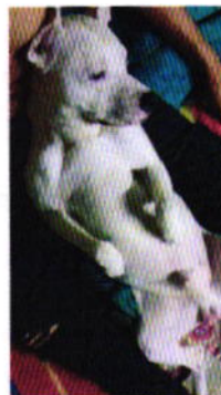
Figuras 2 y 3. Ejemplares caninos motivo de denuncia.

En este sentido, de las constancias que obran en el presente expediente, se desprende que personal de esta Procuraduría llevó a cabo una nueva visita de reconocimiento de hechos, diligencia durante la cual se constató lo siguiente: