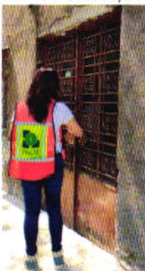
Figura 1. Lugar de los hechos denunciados.

constató la existencia de dos ejemplares caninos localizados en la azotea del inmueble en comento; sin embargo, no fue posible localizar a su persona propietaria, motivo por el cual procedimos a fijar en la puerta del sitio de referencia mediante instructivo el oficio PAOT-05-300/200-1153-2021.