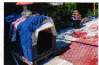
Figuras 4, 5, 6 y 7. Ejemplares caninos “Kira” y “Papi”, alimento y sitio de alojamiento.

Derivado de lo observado, se realizó la siguiente recomendación: