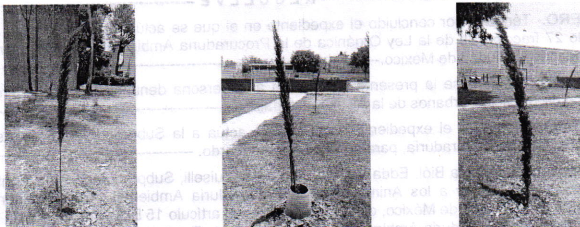
Fotografía 2. Vista de los individuos arbóreos de la especie Cupressus sempervirens .

En virtud de lo anterior y toda vez que se constató la afectación de un individuo arbóreo de la especie F. benjamina , esta Entidad promovió el cumplimiento voluntario por parte de la persona responsable, a efecto de recuperar la masa forestal de la zona, por lo que se llevó a cabo la plantación de cinco árboles de la especie comúnmente conocida como ciprés italiano. Por lo anterior, ésta Procuraduría considera procedente dar por concluida la investigación de conformidad con el artículo 27 fracción VII de la Ley Orgánica de esta Procuraduría.