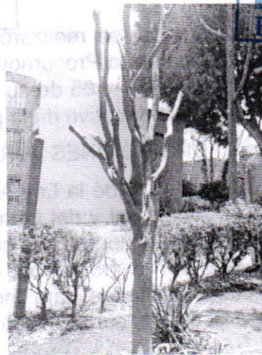
Fotografía 1. Vista del individuo arbóreo de la especie Ficus benjamina .

Aunado a lo anterior, y con la finalidad de contar con mayores elementos, se citó a comparecer a la persona presuntamente responsable de los hechos, quien se presentó a comparecer en las oficinas de esta Procuraduría, manifestando que con ayuda de un jardinero llevó a cabo la afectación del individuo arbóreo motivo de denuncia, con la finalidad de mejorar el área verde donde se localiza, ya que dicho espacio a su decir, desde hace aproximadamente veinticuatro años no recibía mantenimiento; no obstante lo anterior, mediante cumplimiento voluntario se comprometió a realizar la plantación de cinco árboles, con la finalidad de recuperar la masa forestal de la zona.