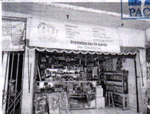
Fotografía 1. Vista del establecimiento mercantil con giro de veterinaria denominado "Club Veterinario"

En seguimiento a la denuncia, personal de esta Subprocuraduría realizó un tercer reconocimiento de hechos, durante el cual: