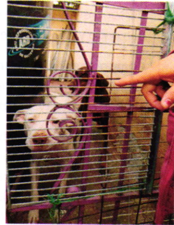
Figuras 1 y 2. Ejemplares motivos de denuncia.

En seguimiento de lo anterior, personal de esta Subprocuraduría estuvo en comunicación con el propietario de los ejemplares con la finalidad de dar seguimiento a la recomendación antes mencionada, constatando que la persona encargada del cuidado de los caninos llevó a cabo la recomendación realizada por personal de esta Entidad.