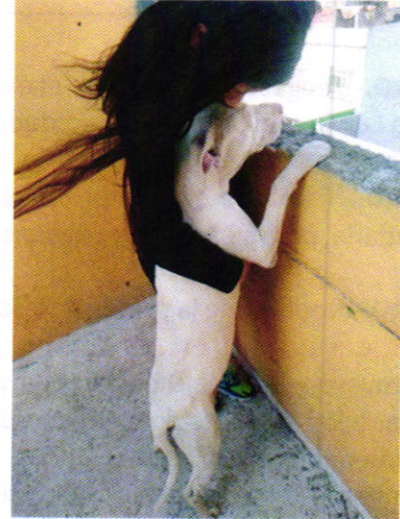
Figuras 3, 4, 5 y 6. Ejemplares motivos de denuncia, todos en condición corporal ideal.

En virtud de lo antes expuesto, esta Entidad considera procedente emitir la presente resolución, de conformidad con el artículo 27 fracción VII de la Ley Orgánica de esta Procuraduría, por el cumplimiento voluntario de las disposiciones jurídicas en materia de bienestar animal.