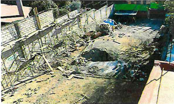
Fuente: Imagen de Octubre de 2020, observando trabajos de construcción y materiales de construcción