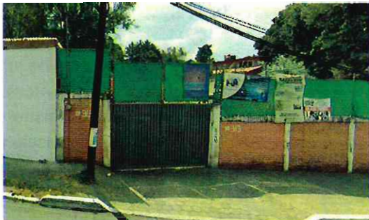
Fuente: Imagen de abril de 2019, se observa un predio delimitado con barda perimetral, sin edificación alguna al interior.

En razón de lo anterior, es importante mencionar que personal adscrito a esta Entidad realizó un análisis multitemporal con las imágenes disponibles en el programa Google Earth utilizando la herramienta Street View, en el que se identificaron los cambios que ha tenido el predio, tal y como se muestra en las siguientes imágenes:-----