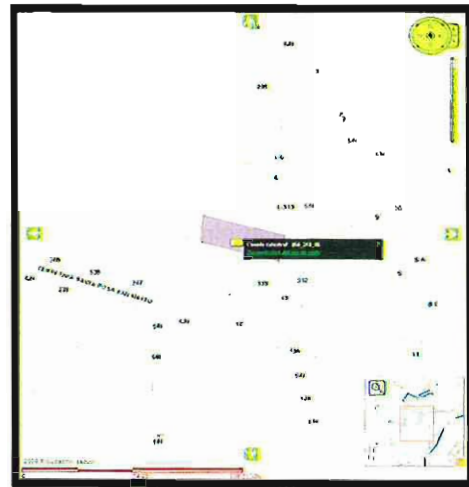
Fuente: Imagen obtenida del SIG-SEDUVI donde el predio de interés se ubica entre el predio identificado como L-313 y 339

Aunado a lo anterior, es de resaltar que mediante correo electrónico de fecha 09 de enero de 2022, la persona denunciante proporcionó fotografías del día 7 del mismo mes y año, manifestando que se presentó personal de la Alcaldía a realizar trabajos de reemplazo de un tubo obsoleto, para lo cual rompieron la banquetta y pavimento para excavar la calle frente al predio objeto de investigación, como se muestra en las imágenes. --