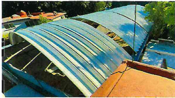
Fuente: Imágenes de diciembre de 2020, observando la colocación de cubierta de arco techo en la nave industrial terminada