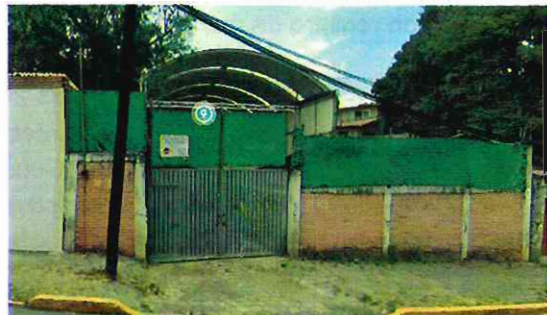
Fuente: Imagen de abril de 2021, se observa un predio delimitado con barda perimetral que al interior cuenta con una nave industrial con arcotecho totalmente terminada.

Asimismo de las documentales que obran en el expediente se cuenta con fotografías proporcionadas por la persona denunciante mediante correo electrónico, a través de las cuales es posible identificar los cambios y las actividades de construcción que se llevaron a cabo en el predio durante el año 2020 y 2021, como se muestra en las siguientes imágenes: -----