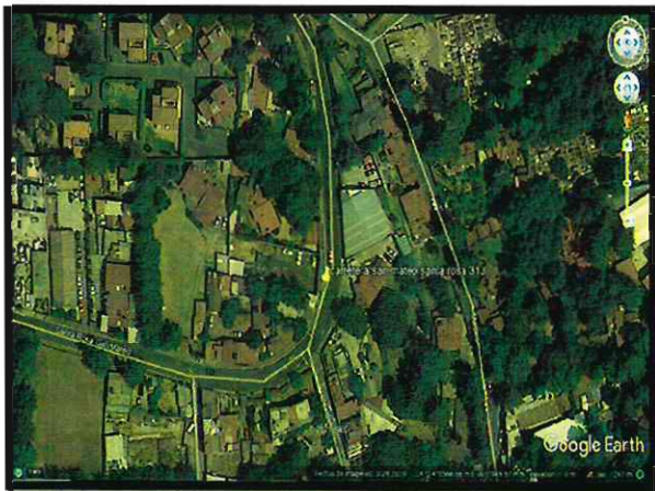
(coordenadas geográficas X: 470577.15 E Y: 2137969.42 N)

Al respecto, para una mejor ubicación del predio objeto de denuncia, este se ubica en las coordenadas geográficas UTM X: 470577.15 E Y: 2137969.42 N y se identifica con la cuenta catastral 056_253_05