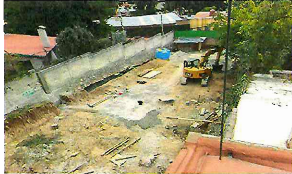
Fuente: Imagen de noviembre de 2020, observando maquinaria realizando la limpieza y nivelación del terreno