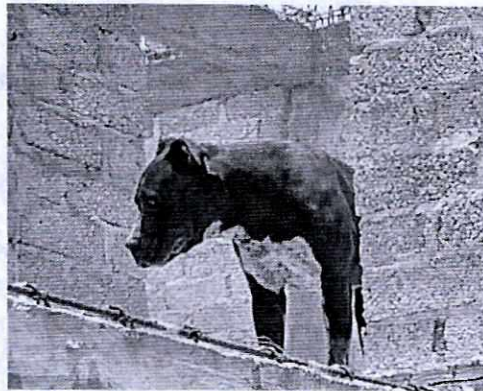
EL EJEMPLAR CANINO SE ENCUENTRA EN EL INMUEBLE.

En este sentido, personal de esta Subprocuraduría llevó a cabo tres reconocimientos de hechos, en horarios y días diferentes al sitio motivo de la denuncia el cual corresponde a un parque sin constatar la existencia del ejemplar canino amarrado a uno de los árboles, asimismo al dirigirnos al domicilio donde habitan los responsables del ejemplar canino se constató que este canino se aloja al interior de la casa deambulando libre por el inmueble mostrando una condición corporal acorde a su talla sin evidencia de lesiones ni signos de enfermedad y/o estrés.