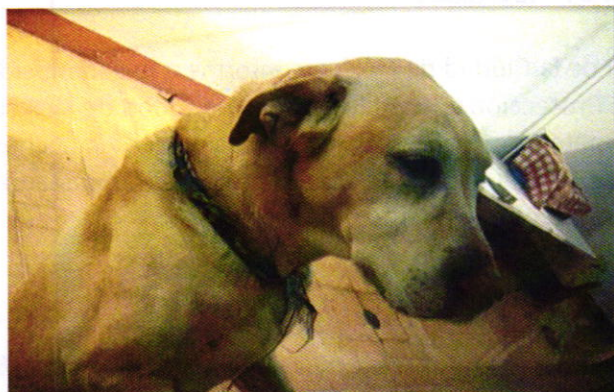
Fotografía 1.- Ejemplar motivo de denuncia.