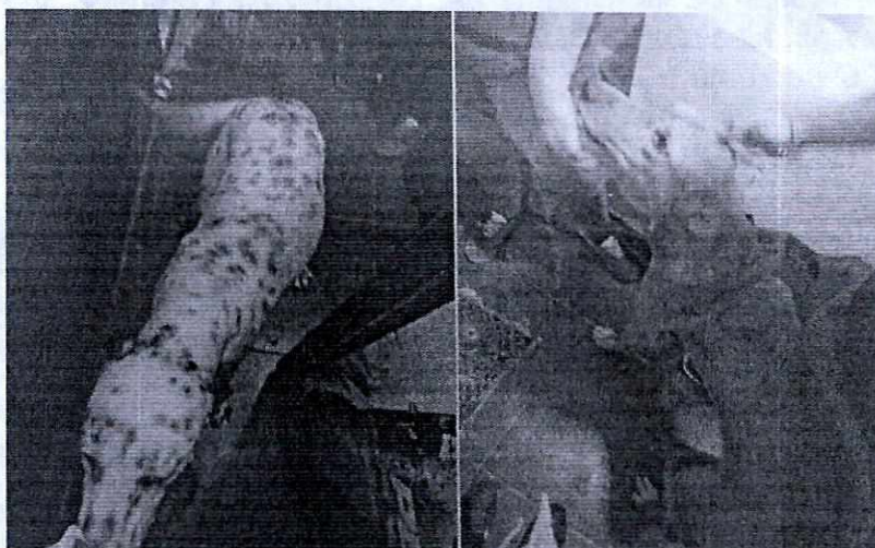
Fotografías.- vista de los ejemplares caninos motivo de la denuncia

No obstante, mediante oficio se hizo del conocimiento del responsable de los ejemplares caninos, las responsabilidades que se tienen que cumplir al tener animales de compañía, conminándolo a su debido cumplimiento.