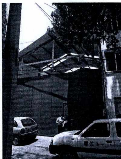
Fotografía 1.- Se observa el negocio con giro de pensión canina.

En este sentido, personal de esta Subprocuraduría realizó una visita de reconocimiento de hechos de acuerdo a lo establecido en el artículo 15 BIS 4 fracción IV de la Ley Orgánica de esta Entidad, en la que se constató la existencia de un establecimiento mercantil en funcionamiento con giro de pensión canina ubicado en calle Tepanco, número 50-B, colonia Parque San Andrés, Alcaldía Coyoacán.