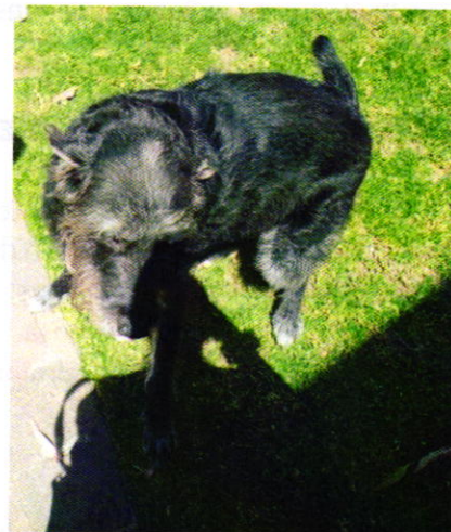
Figura 1 y 2. Ejemplar motivo de denuncia.