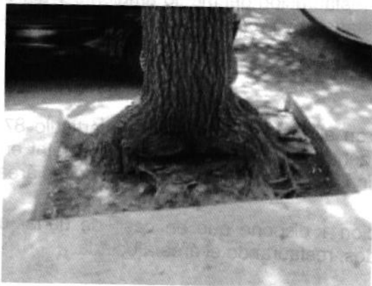
Imagen 2. Se muestra sin cemento el cajete del individuo arbóreo en fecha 10 de mayo de 2019.

Por lo anterior y derivado que esta entidad promovió el cumplimiento voluntario y se constató del retiro del cemento del cajete del individuo arbóreo se erradica la afectación motivo de la denuncia es de considerar dar por concluida la investigación de conformidad con el artículo 27 fracción VII de la Ley Orgánica de la Procuraduría Ambiental y del Ordenamiento Territorial de la Ciudad de México.