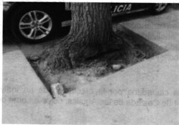
Imagen 1. Se muestra la presencia del cemento en el cajete del individuo arbóreo en fecha 7 de mayo de 2019.

Al respecto, de las documentales que obran en el presente expediente, se desprende que personal de esta Entidad llevó a cabo visita de reconocimiento de hechos, constatando la afectación de un individuo arbóreo de la especie Fraxinus sp comúnmente conocido como fresno de 13 metros de altura con un DAP de 45 cm, el cual presentaba cemento cubriendo aproximadamente una cuarta parte de su cajete y su sistema de raíces.