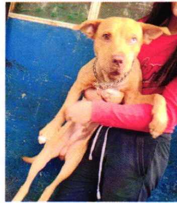
Figuras 2 y 3. Vista del sitio referido en el escrito de denuncia y del ejemplar canino "Zac".

En virtud de lo antes expuesto, esta Entidad considera procedente emitir la presente resolución, de conformidad con el artículo 27 fracción VII de la Ley Orgánica de esta Procuraduría, por el cumplimiento voluntario de las disposiciones jurídicas en materia de bienestar animal.