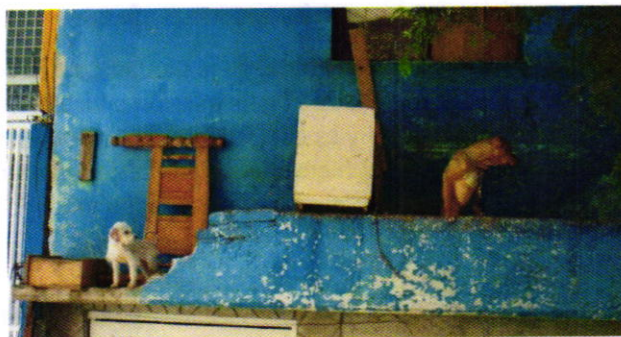
Figura 1. Ejemplares caninos motivo de denuncia.

Derivado de lo observado se realizaron las siguientes recomendaciones: