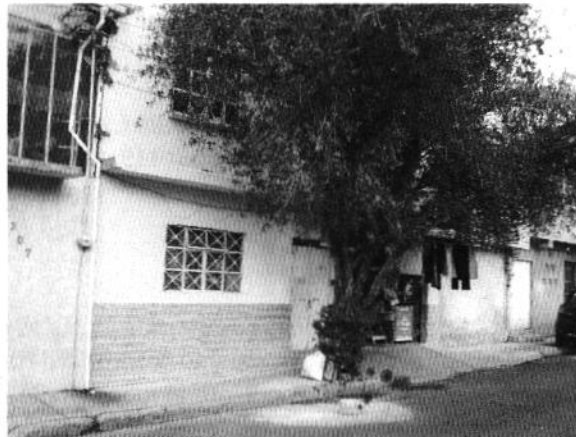
Figura 1. Lugar de los hechos denunciados.

En seguimiento de lo anterior, personal de esta Subprocuraduría informó a la persona denunciante que durante visita de reconocimiento de hechos no se constató la presencia del ejemplar canino en el sitio señalado en su denuncia, por lo que los hechos que motivaron su denuncia dejaron de existir.