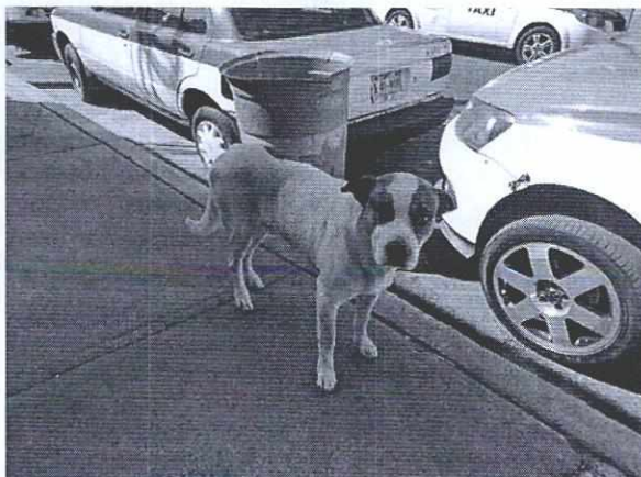
Imágenes 1 y 2. Ejemplar canino motivo de denuncia.