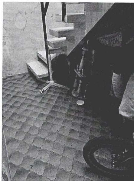
Imágenes 3 y 4. Lugar de descanso del ejemplar.

Es de resaltar que, en el Acuerdo de Admisión, que fue enviado por correo electrónico a la persona denunciante, se le hizo de conocimiento que contaba con un término de seis días hábiles para aportar las pruebas que estimara pertinentes en la investigación de los hechos, lo anterior conforme al artículo 90 del Reglamento de la Ley Orgánica de la Procuraduría Ambiental y del Ordenamiento Territorial de la Ciudad de México; sin embargo durante el procedimiento de investigación, no fueron proporcionados elementos de prueba que pudieran determinar incumplimiento a la normatividad en materia de bienestar animal.