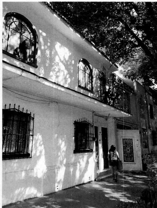
Foto del inmueble referido en el escrito de denuncia.

En este sentido, de las constancias que obran en el presente expediente, se desprende que personal de esta Subprocuraduría llevó a cabo una visita de reconocimiento de hechos, de acuerdo a lo establecido en el artículo 15 BIS 4 fracción IV de la Ley Orgánica de esta Entidad, diligencia durante la cual no se constató la presencia de algún ejemplar canino con las características descritas en la denuncia; aunado a lo anterior, se tuvo comunicación con una persona vecina del lugar donde se denunciaron los hechos objeto de la presente investigación, quien hizo de conocimiento que no ha observado la presencia de algún ejemplar canino en esa inmueble.