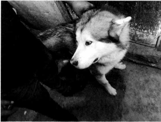
Fotografía 1.- Ejemplar canino llamado "Togo".