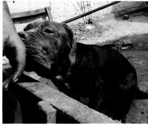
Fotografía 2.- Ejemplar canino llamado "Carlo".

Es de resaltar que, en el Acuerdo de Admisión, que fue enviado por correo electrónico a la persona denunciante, se le hizo de conocimiento que contaba con un término de seis días hábiles para aportar las pruebas que estimara pertinentes en la investigación de los hechos, lo anterior conforme al artículo 90 del Reglamento de la Ley Orgánica de la Procuraduría Ambiental y del Ordenamiento Territorial de la Ciudad de México; sin embargo durante el procedimiento de investigación, no fueron proporcionados elementos de prueba que pudieran determinar incumplimiento a la normatividad en materia de bienestar animal.