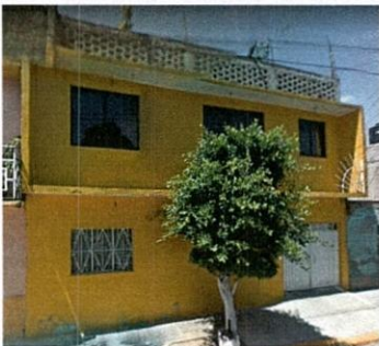
Agosto 2009. Se observa un inmueble de dos niveles con un individuo arbóreo de la especie ficus al frente del predio.

A efecto de mejor proveer, personal adscrito a esta Subprocuraduría realizó un estudio multitemporal con imágenes obtenidas del programa electrónico Google Maps, haciendo uso de su herramienta Street View y comparando las imágenes del programa con las imágenes proporcionadas por la persona denunciante, se constató la afectación mediante el desmoche de un individuo arbóreo de la especie ficus, el cual se ubicaba al frente del predio. -----