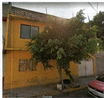
Google Maps-Street View. marzo 2019.