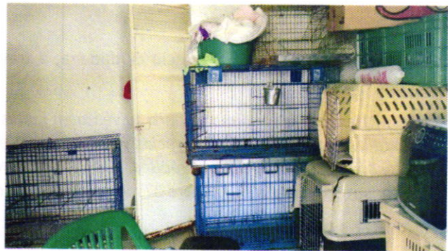
Figuras 1 y 2. Lugar de los hechos denunciados.

En seguimiento de lo anterior, personal de esta Subprocuraduría informó a la persona denunciante que durante visita de reconocimiento de hechos no se constató la presencia de los ejemplares caninos o felinos en el sitio señalado en su denuncia, por lo que los hechos que motivaron su denuncia dejaron de existir.