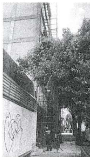
Imágenes proporcionadas por la persona denunciante

Esta Subprocuraduría, emitió oficio dirigido al Director Responsable de Obra, Propietario y/o Encargado de la Obra del inmueble objeto de investigación, a efecto de que realizara las manifestaciones que