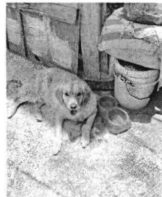
Figura 1 y 2. Ejemplar denunciado.