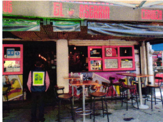
Figura 2. Establecimiento mercantil motivo de denuncia.

En este sentido, de las constancias que obran en el presente expediente, se desprende que personal de esta Procuraduría llevó a cabo una nueva visita de reconocimiento de hechos durante la cual se constató que derivado del cumplimiento voluntario por parte de la persona que se ostentó como representante legal del establecimiento mercantil motivo de denuncia, se llevó a cabo el retiro de la bocina localizada en la vía pública siendo reubicada el interior del sitio y con un volumen ambiental.