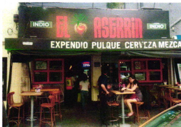
Figura 1. Establecimiento mercantil motivo de denuncia.

En este sentido, de las constancias que obran en el presente expediente, se desprende que personal de esta Procuraduría llevó a cabo una visita de reconocimiento de hechos, de acuerdo a lo establecido en el artículo 15 BIS 4 fracción IV de la Ley Orgánica de esta Entidad, diligencia durante la cual desde el espacio público se constató la generación de emisiones sonoras por el funcionamiento de una bocina utilizada para la reproducción de música grabada, la cual se localiza al exterior del establecimiento mercantil denominado "El Aserín", asimismo se tuvo la atención de una persona que se ostentó como encargada de dicha negociación y a quien se le notificó el oficio PAOT-05/200-0664-2020.