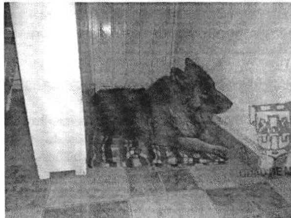
Figura 1 y 2. Ejemplar denunciado.