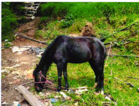
Fotografías 1 y 2. Se muestran caballos motivo de denuncia y sitio de alojamiento.

Por lo antes señalado personal de esta Entidad se constituyó en el domicilio del propietario de los animales motivo de denuncia, sitio en donde se notificó el citatorio correspondiente, con la finalidad de que la persona responsable manifestara lo que a su derecho conviniera, durante la diligencia, se exhortó a la persona de quien se tuvo la atención, a proveer a los animales algún elemento que les permitiese resguardarse del clima, realizar el retiro de los residuos sólidos del sitio, así como a colocarles recipientes con agua de manera permanente durante su estancia en el área previamente descrita.