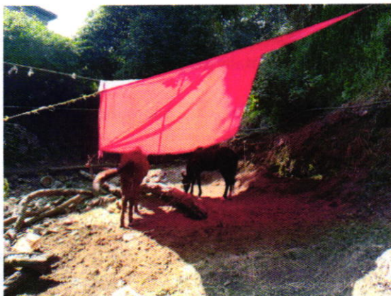
Fotografía 3. Se muestran adecuaciones

En seguimiento a la presente investigación, y toda vez que el citatorio no fue atendido, personal de esta Entidad se realizó dos nuevas visitas de reconocimiento de hechos al sitio donde se encontraban los ejemplares equinos, constatando que se cumplieron las recomendaciones señaladas por esta Entidad.