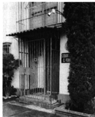
Evidencia del cumplimiento voluntario

Medellín 202, piso 4, colonia Roma Sur Alcaldía Cuauhtémoc, C.P. 06000, Ciudad de México Tel. 5265 0780 ext 12011 Y 12400