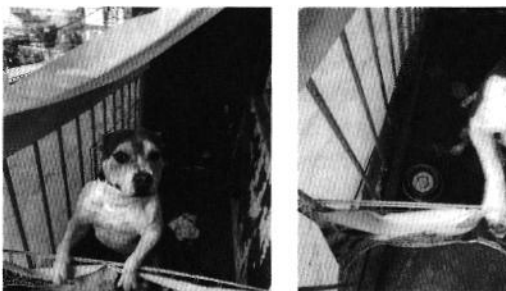
Ejemplar canino denunciado y su lugar de alojamiento.

Medellín 202, piso 4, colonia Roma Sur Alcaldía Cuauhtémoc, C.P. 06000, Ciudad de México Tel. 5265 0780 ext 12011 Y 12400