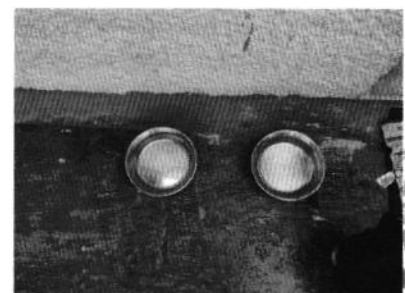
CIUDAD DE MÉXICO CIUDAD INNOVADORA Y DE DERECHOS