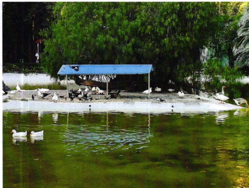
Fotografía 1. Vista del espacio en donde se refugian las aves acuáticas.

Adicionalmente, se realizaron dos nuevas visitas de reconocimiento de hechos, a fin de constatar el estado en que habitan las aves acuáticas motivo de denuncia, diligencias durante las cuales se observó que las aves presentaban plumaje abundante, continuo y colorido, sin lesiones en las patas, además de que se lleva a cabo la limpieza del agua y del estanque en general, contando en ambas ocasiones a las 42 aves observadas con anterioridad, las cuales exhibieron un comportamiento relajado al aproximarse el personal actuante.