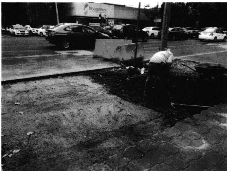
Fotografía 1. Vista de la jardinera motivo de denuncia, se observa la aplicación de concreto de lado izquierdo.

que se presentara en las instalaciones que ocupa esta Entidad, a fin de manifestar lo que a su derecho conviniera.