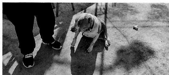
En la imagen se observa al canino de nombre "Kimba".