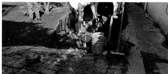
En la imagen se observa al canino de nombre "Luna".