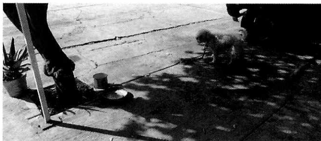
En la imagen se observa al canino de nombre "Toto".