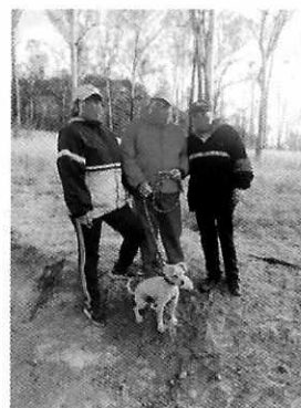
En la imagen se observa al canino de nombre "Toto".

Medellín 202, piso 4, colonia Roma Sur Alcaldía Cuauhtémoc, C.P. 06000, Ciudad de México Tel. 5265 0780 ext 12011 Y 12400