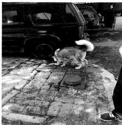
En la imagen se observa al canino de nombre "Zeus".