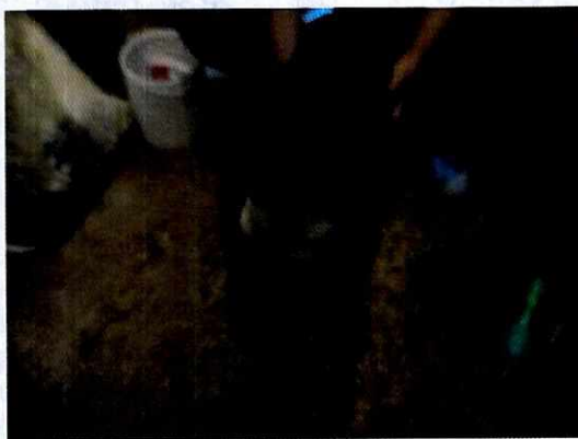
Fotografía.- vista del ejemplar canino motivo de la denuncia

No obstante, mediante oficio se hizo del conocimiento del responsable de los ejemplares caninos, las responsabilidades que se tienen que cumplir al tener animales de compañía, conminándolo a su debido cumplimiento.