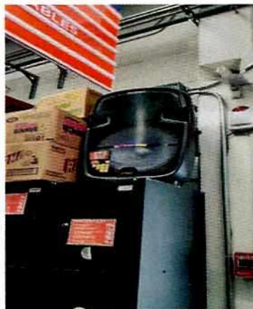
Fotografías 1-2. Fachada del establecimiento. Bocina que emplean para llamar la atención de la clientela.

Sobre el particular el apoderado del establecimiento, se presentó a comparecer a las oficinas de la presente Entidad, diligencia en la cual manifestó que contaba con los permisos necesarios para su legal funcionamiento. Asimismo, se comprometió a realizar las acciones que se requirieran en caso de que presentaran una molestia a los vecinos colindantes, entregando con ello, además de las documentales que amparan el legal funcionamiento, un informe sobre las acciones realizadas para evitar que se presenten este tipo de inconformidades a los vecinos.