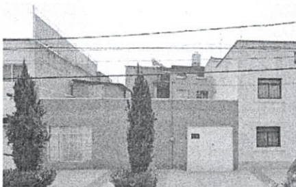
Marzo 2021