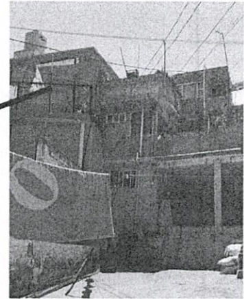
Cuerpo constructivo en la colindancia posterior poniente del predio

En el predio objeto de investigación se constató la existencia de 4 cuerpos constructivos, los marcados con entramados, son los cuerpos donde se realizan las actividades de construcción.