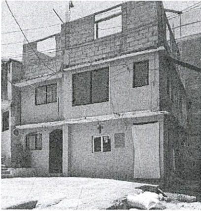
Cuerpo constructivo en el frente del predio