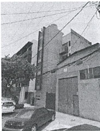
Imagen de fecha Mayo de 2016

Al respecto, personal adscrito a esta Subprocuraduría, realizó un análisis multitemporal del inmueble objeto de denuncia con imágenes obtenidas por medio de la página electrónica Google Maps, utilizando la herramienta Street View, en las que se observó que de las imágenes disponibles de mayo de 2016, agosto de 2017 y junio de 2019, el inmueble objeto de denuncia cuenta con las mismas características físicas a las observadas durante visita de reconocimiento de hechos, realizada por personal de esta Entidad. -----