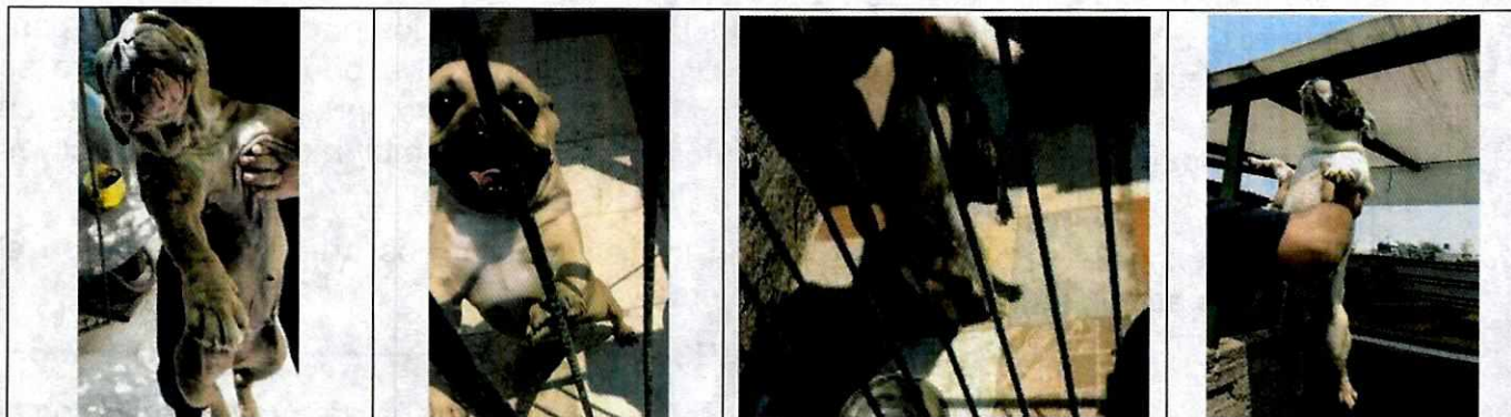
Imagen 1 a 12. Se observan 12 ejemplares caninos con incisiones quirúrgicas por motivo de esterilización

En complemento a lo anterior, la persona responsable de los ejemplares caninos se presentó a comparecer en las oficinas de esta Entidad, diligencia en la que se comprometió a esterilizar a la totalidad de los cánidos, en un término de 20 días naturales, contados a partir del día siguiente de la fecha de comparecencia.