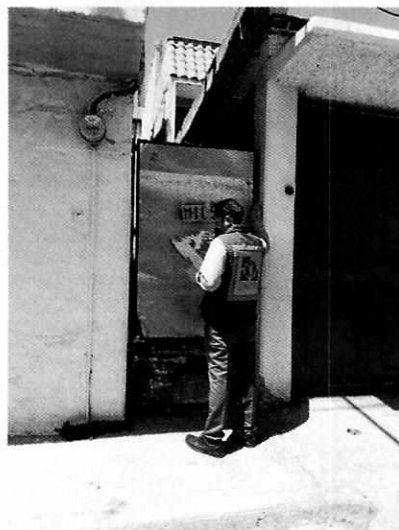
Figura 1. Lugar de los hechos denunciados.

En seguimiento de lo anterior, personal de esta Subprocuraduría informó a la persona denunciante que durante visita de reconocimiento de hechos no se constató la presencia del ejemplar canino en el sitio señalado en su denuncia, por lo que los hechos que motivaron su denuncia dejaron de existir.