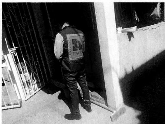
Figura 1. Lugar de los hechos denunciados.

En seguimiento de lo anterior, personal de esta Subprocuraduría informó a la persona denunciante que durante visita de reconocimiento de hechos no se constató la presencia del ejemplar canino en el sitio señalado en su denuncia, por lo que los hechos que motivaron su denuncia dejaron de existir.