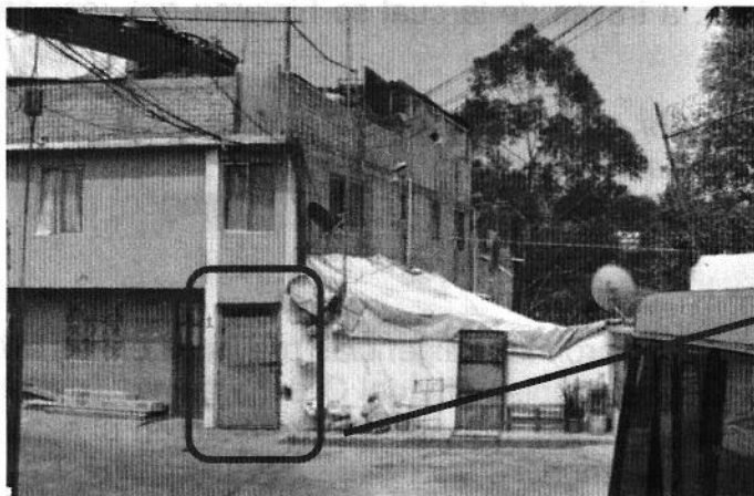
Fachada del domicilio relacionado con la denuncia. Calle Del Río número 1, colonia La Angostura, Alcaldía Álvaro Obregón

En este sentido, de las constancias que obran en el presente expediente, se desprende que personal de esta Subprocuraduría llevó a cabo una visita de reconocimiento de hechos, de acuerdo a lo establecido en el artículo 15 BIS 4 fracción IV de la Ley Orgánica de esta Entidad, diligencia de la cual se levantó el acta circunstanciada correspondiente, mediante la cual se hizo constar que a pesar de haber realizado un recorrido por la calle Del Río, no se observó la presencia en la vía pública de los ejemplares caninos relacionados con su denuncia. Asimismo, en ese mismo acto, personal de esta Entidad se entrevistó con una persona, la cual manifestó ser habitante del inmueble, quien negó ser responsable de algún ejemplar canino.