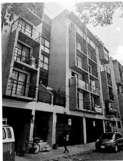
Imagen del sitio motivo de la denuncia.

En este sentido, de las constancias que obran en el presente expediente, se desprende que personal de esta Subprocuraduría llevó a cabo la atención de la denuncia ciudadana, de acuerdo a lo establecido en el artículo 15 BIS 4 fracción I de la Ley Orgánica de esta Entidad, se tuvo comunicación vía telefónica con la persona denunciante, quien refirió que al ejemplar canino lo dejan en un balcón, sin embargo señaló desconocer el número del departamento en el cual se encuentra, por lo que personal adscrito a esta Procuraduría, realizó un reconocimiento de hechos, durante el cual se constató que efectivamente en el sitio en comento presenta interiores, no obstante lo anterior, no se constató la existencia de un ejemplar que se encontrara en alguno de los balcones del inmueble.