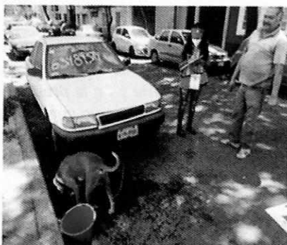
Fotografía 1: Lugar de motivo de denuncia

En este sentido, de las constancias que obran en el presente expediente, se desprende que personal de esta Subprocuraduría llevó a cabo una visita de reconocimiento de hechos, de acuerdo a lo establecido en el artículo 15 BIS 4 fracción I de la Ley Orgánica de esta Entidad, en la cual se tuvo comunicación con el propietario del ejemplar, quien atendió la diligencia, al respecto se observa la presencia de un ejemplar canino de raza bóxer de un año y seis meses de edad, con una condición corporal ideal, amarrado a un carro con una correa de 1.5 metros, aproximadamente, mismo que es alimentado con croquetas tres veces al día y cuenta con un recipiente para agua, en cuanto a su comportamiento no muestra signos de estrés o temor, adicionalmente se observa una protusión en el tercer parpado, el visitado indicó que lo había llevado al Médico Veterinario Zootecnista, quien le recomendó unas gotas.