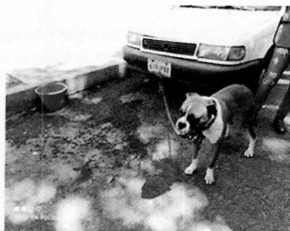
Fotografía 2: Se observa ejemplar canino macho motivo de denuncia de nombre "Canelo"

Por lo que hace a los hechos denunciados, se le realizaron las recomendaciones toda vez que se encontró amarrado, tener agua permanente, así como de no suspender el tratamiento oftálmico correspondiente a la afectación que presenta en su ojo.