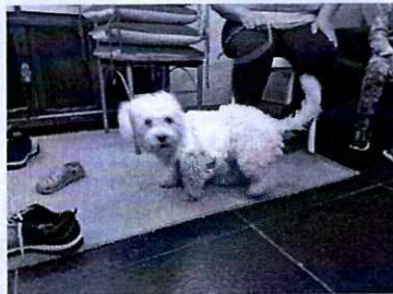
FOTOGRAFÍA.- Vista del ejemplar canino.

Mediante oficio se hizo del conocimiento de la responsable del ejemplar canino, las responsabilidades que se tienen que cumplir al tener animales de compañía, conminándolo a su debido cumplimiento.