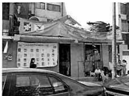
Fotografía 2. Vista del sitio referido en el escrito de denuncia.

No. de Folio: PAOT-05-300/200- 4 4 1 4 -2020