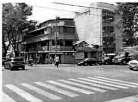
Fotografía 1. Vista del sitio referido en el escrito de denuncia.

Aunado a lo anterior, y con la finalidad de contar con mayores elementos, se citó a comparecer a la persona encargada del establecimiento mercantil motivo de denuncia, presentándose en las oficinas de esta Procuraduría