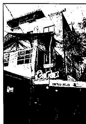
Fuente PAOT: reconocimiento de hechos de fecha 13 de enero de 2023.

En este sentido, personal adscrito a esta Entidad llevó a cabo un análisis multitemporal de las imágenes obtenidas mediante el programa Google Maps utilizando la herramienta Street View, en las que se observó que desde abril de 2019 en el sitio denunciado existe un inmueble de 5 niveles de altura de aparente uso habitacional, por lo que las actividades constatadas en el reconocimiento de hechos y de lo observado en dicha consulta, se desprende que se realizó una remodelación de un nivel preexistente. --