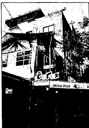
Fuente PAOT: reconocimiento de hechos de fecha 13 de enero de 2023.

En este sentido, personal adscrito a esta Entidad llevó a cabo un análisis multitemporal de las imágenes obtenidas mediante el programa Google Maps utilizando la herramienta Street View, en las que se observó que desde abril de 2019 en el sitio denunciado existe un inmueble de 5 niveles de altura de aparente uso habitacional, por lo que las actividades constatadas en el reconocimiento de hechos y de lo observado en dicha consulta, se desprende que se realizó una remodelación de un nivel preexistente. --