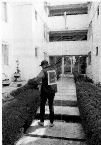
Imagen del sitio motivo de la denuncia.

Medellín 202, piso 4, colonia Roma Sur Alcaldía Cuauhtémoc, C.P. 06000, Ciudad de México Tel. 5265 0780 ext 12011 Y 12400