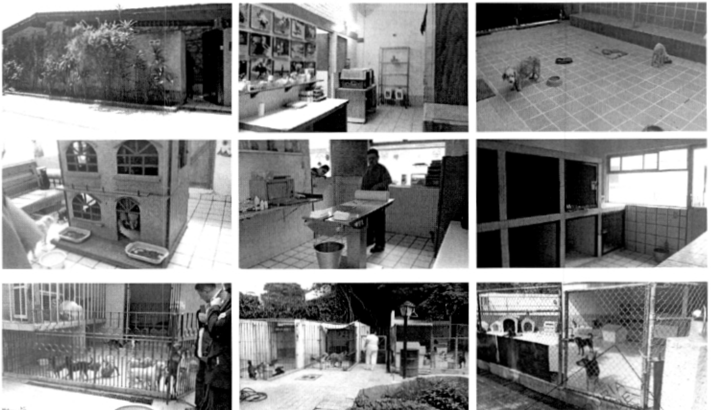
Vistas tomadas el 11 de agosto de 2014

El alojamiento es acorde en atención a las características y necesidades particulares de cada uno de los ejemplares caninos y felinos en albergue dentro de las instalaciones de la Fundación Calidad de Vida Animal, A.C. Cada una de las áreas de alojamiento se observó en buenas condiciones de higiene, con espacio suficiente que permite la movilidad y desplazamiento de los ejemplares caninos y felinos en albergue, contando con recipientes con agua para beber y alimento sólido (croquetas).