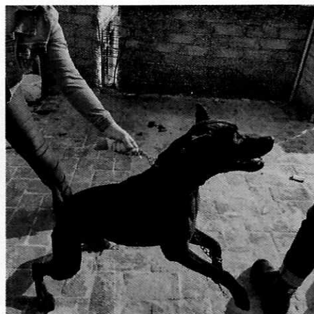
Fotografías 1 y 2. Ejemplar canino motivo de denuncia.

En seguimiento de lo anterior, personal de esta Subprocuraduría informó a la persona denunciante que durante la segunda visita de reconocimiento de hechos no se constató la presencia del ejemplar canino en el sitio señalado en su denuncia, toda vez que habitantes del lugar refirieron que los propietarios cambiaron de domicilio, por lo que los hechos que motivaron su denuncia dejaron de existir.